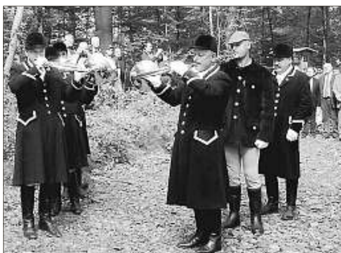
Les trompes de chasse ont retenti dans le sous-bois, installant l'ambiance festive.

Une journée travaux le 10 mars avait réuni plus de soixante membres de l'APM répondant à l'appel avec plaisir. Ainsi, les 15 et 16 juin, l'association avait pu organiser son premier stage. Des fabricants