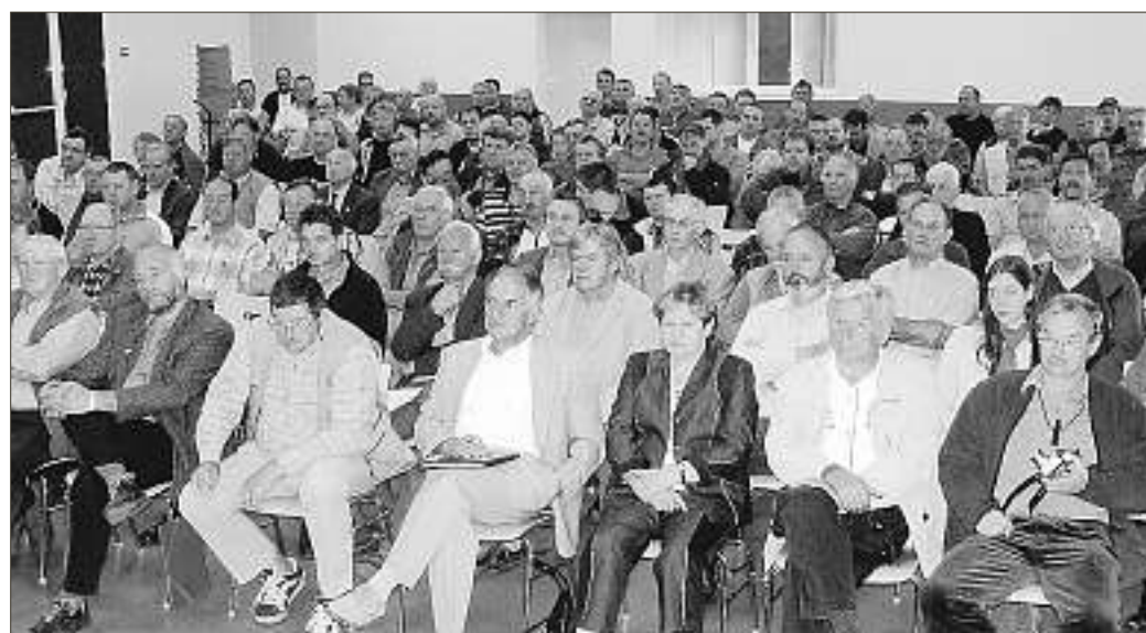
L'assemblée générale des piégeurs s'est déroulée à Vallerange.